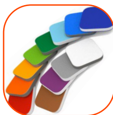
Elementy z kolorowego trójwarstwowego polietylenu hdpe o grubości 15 mm