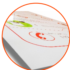
Tablice informacyjne z wydrukiem na folii odpornej na UV. Naklejonej na cynkowaną blachę stalową.