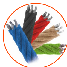
Liny polipropylenowe o średnicy 16 mm, typu PP-Multislip, z rdzeniem stalowym.