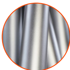
Elementy wykonane ze stali nierdzewnej AISI304, całkowicie odporne na różne warunki atmosferyczne.