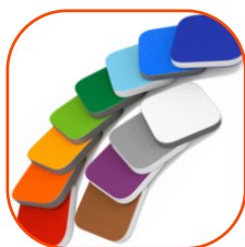
Elementy z kolorowego trójwarstwowego polietylenu hdpe o grubości 15 mm