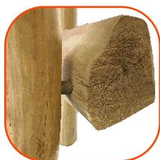
Naturalne drewno robinii akacjowej